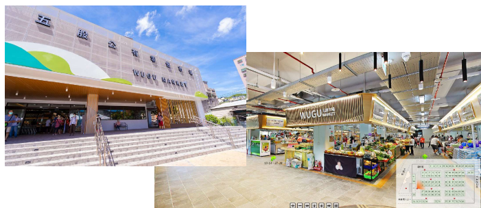
五股公有零售市場 五股區工商路3號