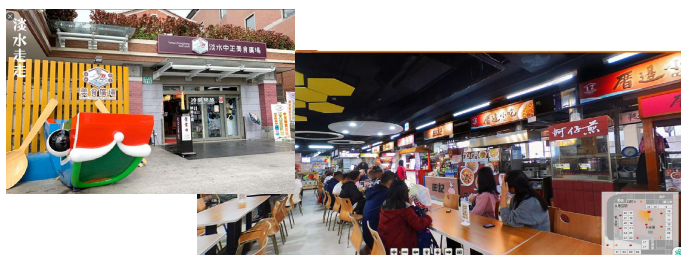
淡水中正美食廣場 淡水區中正路115號